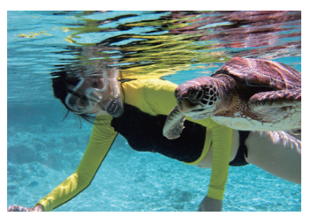
タヒチで海ガメと泳ごう