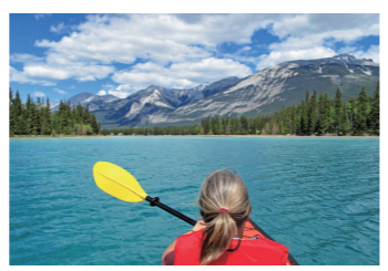
カナダの大自然を探検しよう

New Words Tahiti □ cōttage □ cōconut(s) □ cōokie(s) □ amōng □ tōurist(s) □ spōt(s) up close