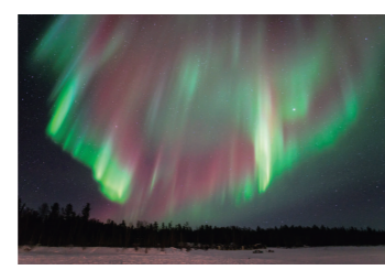
フィンランドでオーロラを見よう